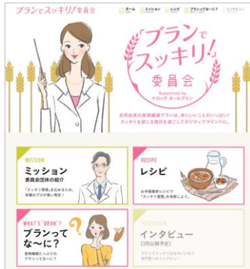
「ブランでスッカリ！」委員会 公式 Web サイトイメージ

「ブランでスッカリ！」委員会公式 Web サイト( http://brandesukkiri.allbran.jp )では、腸内環境を整え、「スッカリ習慣」を体験するために役立つ情報を発信いたします。「小麦ブラン」の効能の紹介や解説をはじめ、医師・専門家による便秘や腸内環境に関する解説やアドバイス、栄養バランスのとれた食生活を送って「スッカリ習慣」を体験するためのレシピなども紹介いたします。